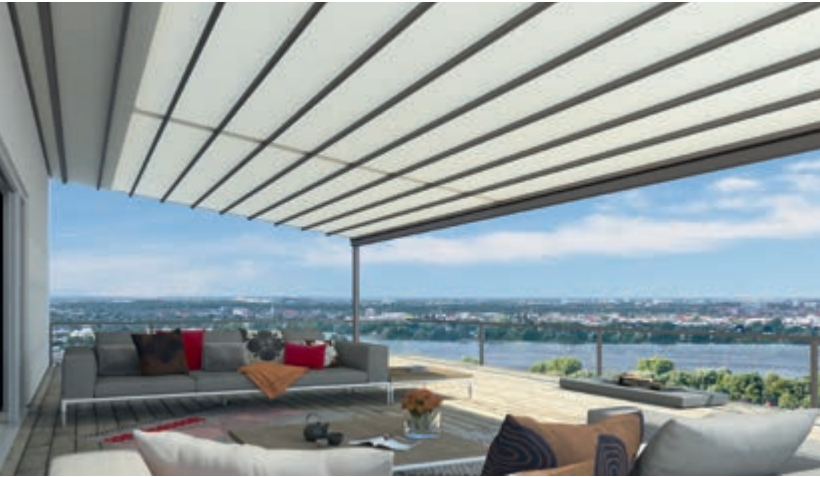
Gestellfarbe WT 029/70786 | Dessin Pergona transluzent PE 10 (Weiß)