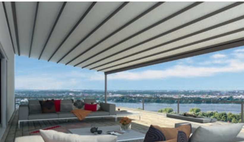
Gestellfarbe WT 029/70786 | Dessin Pergona classic NA 78410 (Weiß)

9 WiGa-Trendfarben 47 Standard-RAL-Farben Stimmen Sie die PergoTex II perfekt auf Ihre Terrasse ab.